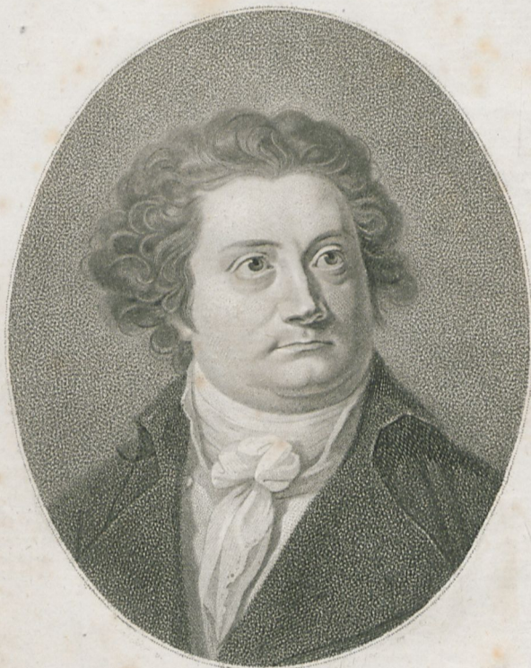
AUGUST WILHELM IFFLAND geboren den 19 ten April 1759.