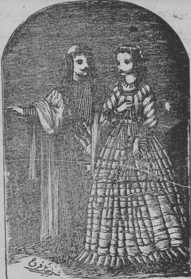
الملك سعيد والأمير مري

وقبلت يديه وقالت لها علم ايها الامير . وسيدي الخطير . قد جاء الي بالفرج بعد التعسير . وتعاهدت هي وياه بان لا ياخذ غيرها من النساء ووعدته ايضا ان لا تاخذ غيره من الرجال ولو قطعت بالسيف الصقال . وبعد ذلك ودعوا بعضهم البعض وكل واحد ذهب الى سيلة يرجع الكلام الى وامير دياب بعد قتل الزناتي امر بتعليق