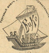
سر ایبلر تجاری

امپراتور زاده میخایل نیقولویچک و شوکتلی ایران شاهنشاهنگ چای تجارت شرکتی و سوتکی قومساینا موسوقواده زاساقساز و زاسایسکی مملکتلری و ایران ایچون اولان شمبهلری: تقلیدسه اون مسداننده دیر ساتالانلر سیراسنده در اصل سرمایه و تنخواهی ۶ ملیون روبله. ایلک آگوری ۲۰ میلیون روبله باقندر خوش زاجه قیس طعم تندرک بزم جاگ بزمی حاضریندن در. هر کیس بزمس چایدن بر دمه ایشلشنه نه اینکه اوزی اوکا اولده اولوب همه وقت اولاندن ایشلده چکدر، حتی دوست و آشناسلرینه دخی تعریف و توصیه ایده چکسدر موسوقواده و آدسنده اوز عمارتمزده اولان بزم کار خاله لرمزده بیگ بش یوزدن زیاده قلمه ایشیلور. خواه روسیه دولتنده خواه خارجی مملکتلرده بر گوشه و بر یوکه اعلا خاصه گمی علامتلی و سوتکی چای ایشلمسون بو جهتن بزم فریماز یورویا قطه اعلا درجه لرگ بریسنی دوتش. بزم چای دولت (باندرول) ی بینی علامت ایله سایلور. براه تر ایزت ایله گونیدیلن چایک گورمگی اعاده اولنور. شرکتک ادارسی موسوقواده در، مخصوصی شمبهلری: اوهسا، پتروبوغ، روستور، وراشوا، یقائتربووغ، خاروف، تقلیس، ریفا و بلنبا، سیمفرو بول، شهرینده ویزه فورود و ایریسیت هفته بازارلرینده در. گمی نشانلی جای ایستیکر.