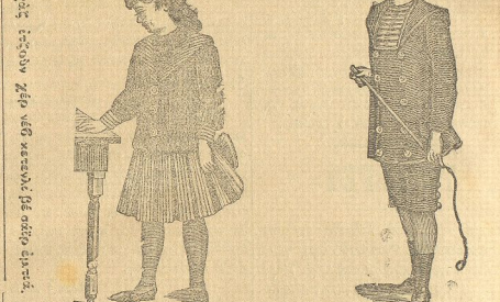
Μετὰ τὴν ἐπιβόην τῆς ἐπιτομίας αὐτῆς γλώσσας τῶν Ὀθωμανικῶν Κράτους...