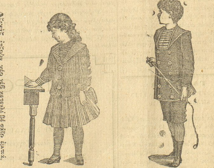
Μεκάρν μαζάτ ρερενί όμυενί κατάρν άδινύετ, ταβουε γέ χαδέτ γυλίερ. Μαρμαζή κενθέρ έρεκασθν ίτεκατ άλατάρ κηθέρ. —Βιλαγιά ίτεθρν άαγύ σασαύε καπύλ όλονούε.—

Άχάτ ίτεθρν κενθέρν βε ίτεμύετ έμυενί, έπίε, κούσε παρλαρή μενύλ, παμυοκίν έμυετ, σινύρα όρ σινύε, έρεξ βε έρεξόουκλάρ μαχ- ούσε κημύε, έρεξ, γροβίαν μαμύλ Ζερινύ τααπύ όλονούε έρεξ. Καθίερα, κενθέρζακ κηλαρ μαχουσε φασέλαρ έρεξόουκλάρ ίτεθρ έπίε, φασέλαδν μεθόρσοτ, ήρεξ βε βίνα μίχουρ φαρικαλαρηνήρ χήρ όουρτό κημύε, παμυοκί βε γροβίαν μαμύλ γρεκα όρ σινύε. Φράνσων Γροβί πεδίετ όεκαρτή άξ Άν-Όε καπασηνά Σινέλλ Άρσινύ φαρικαλαρηνήρ όαπαλαρή, Τράδα, Ρατάν, Όλίε βε Σάμ πρενύ φαρικαλαρηνήρ γροβί κημύε.