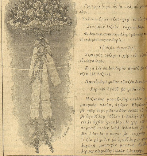
Σαχηλίη ΔΑΔΑΦΟΙ ΜΙΣΑΗΛΑΛΙ

(Αγαθὴν κερματιστὴν Νοῦμ. 266 β. ἑξοικὸς ἑταίριον Νοῦμ. 2-1)