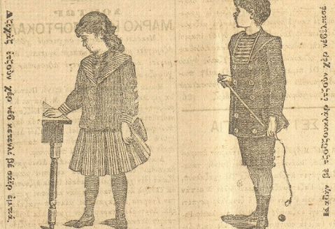
Μεγάλο... Μεγάλο... Μεγάλο...