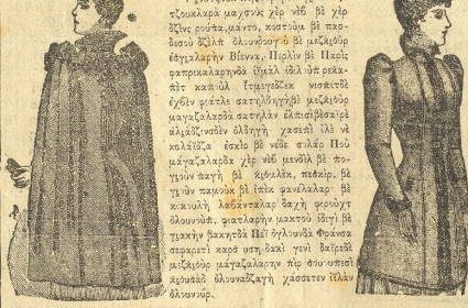
Γενοβεφα... Μεγιστορ ριμαγιε...