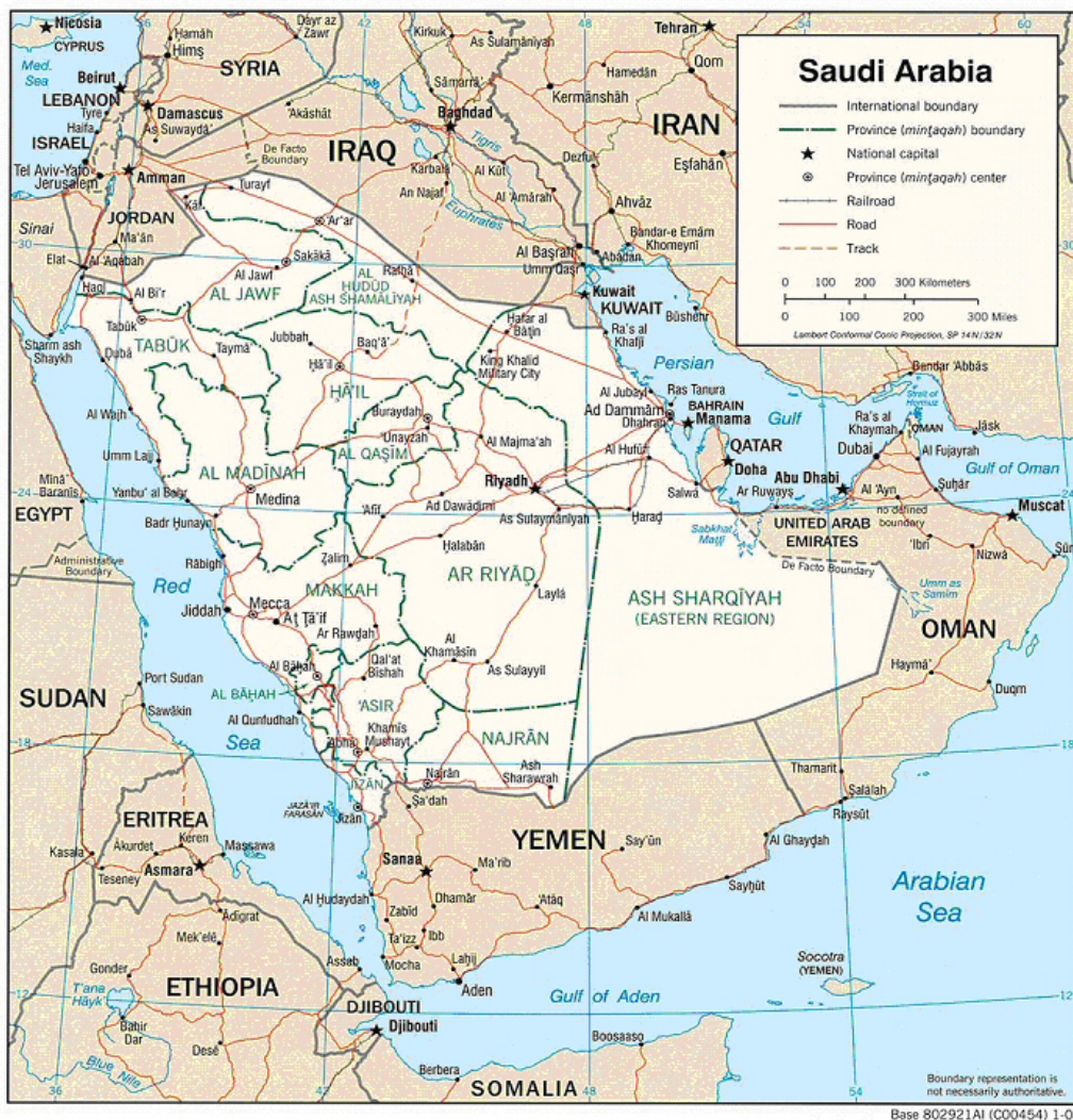
Kaart 1: Saoedi-Arabië 2003 (politiek)