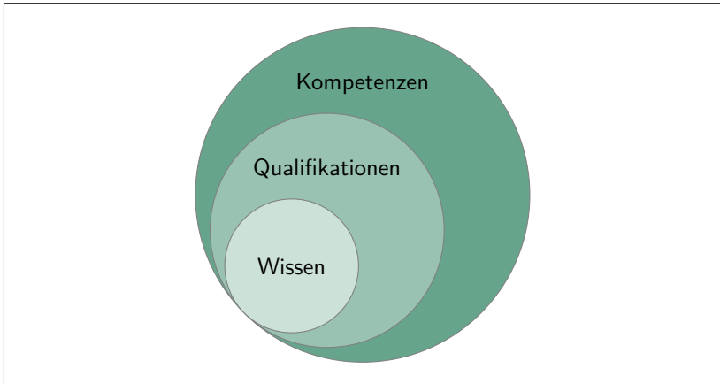
Abbildung 1: Lernergebnisse in Anlehnung Erpenbeck/Heyse (2007)

wird. Nach erfolgreicher Anerkennung können diese außerhochschulischen Vorleistungen dann für die Anrechnung auf Studieninhalte genutzt werden (vgl. Hanak/Sturm 2013, S. 9).