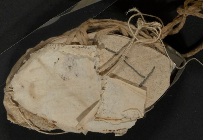
Morbio 29 (31)

... (Text accompanying the diagram, likely describing its function or the process it illustrates.)