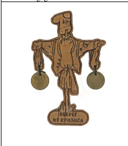
Abbildung 3 Talisman gegen die Krise

ständlich auch eine Geschäftssphäre – hier finden sich eine Reihe von Dienstleistern, die mit magischen Diensten ihren Lebensunterhalt verdienen ebenso, wie Güter und Waren magischer Natur, die monetäre Funktionen verrichten, wie etwa Amulette gegen die Krise.