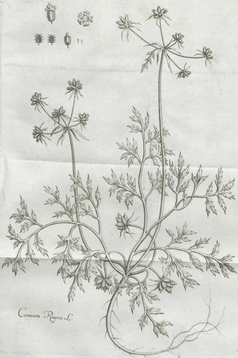
Comum Royenii L.