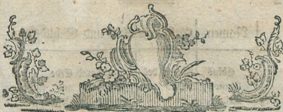
Tabelle über das Vornehmste aus der Mythologie.