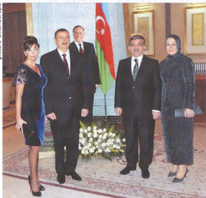
Aserbaidischans First Lady Mahriban Aljewa, Präsident Ilham Aljew und sein türkischer Amtskollege Abdullah Gul mit Frau (v.l.n.r.) in Baku, 7. November 2007.