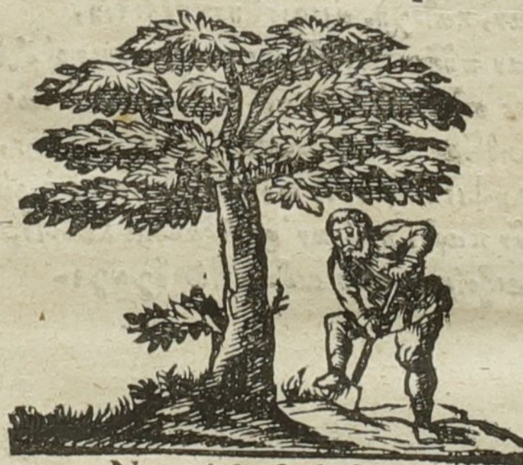
Naturâ & Industriâ.

TRAJECTI ad RHENUM, Apud PETRUM DANIELIS SLOOT, ANNO M. DC. XLV.