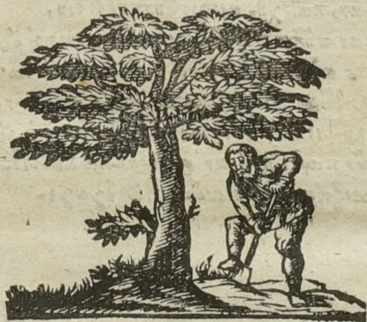
Naturâ & Industriâ.