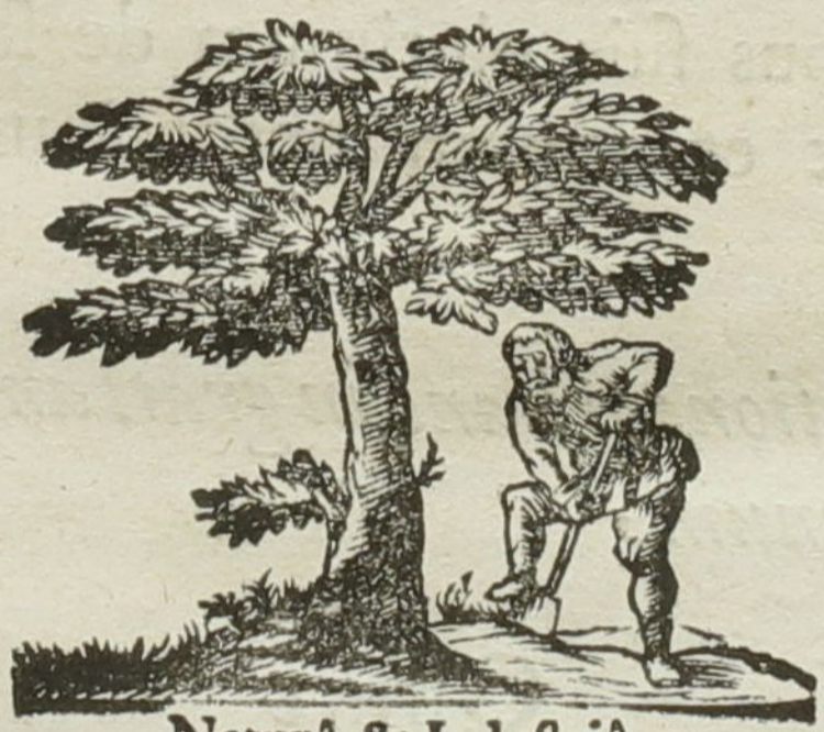
Naturâ & Industriâ.

TRAJECTI ad RHENUM, Apud PETRUM DANIELIS SLOOT, ANNO M. DC. XLV.