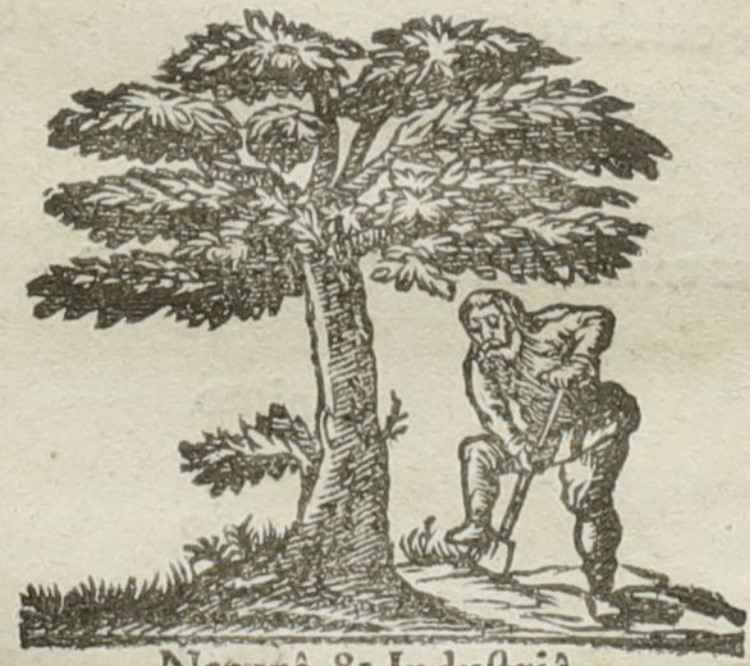
Naturâ & Industriâ.