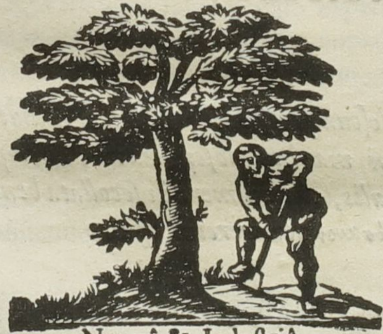
Naturâ & Industriâ.

TRAJECTI ad RHENUM, Ex Officinâ IOHANNIS à NOORTDYCK, ANNO M. DC. XLVI.