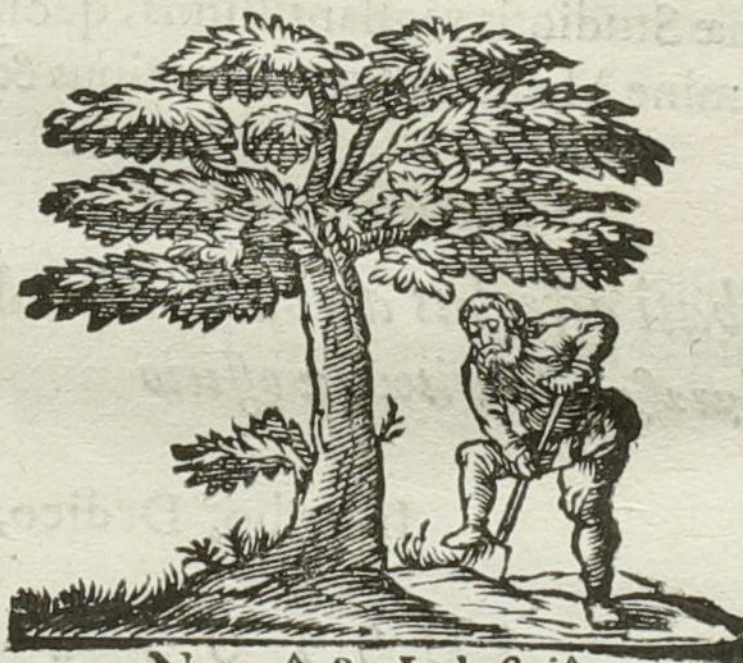
Naturâ & Industriâ.