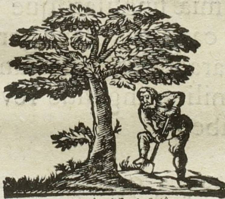
Natura & Industria.

Ad diem 30. Septembris, horâ 9. matutinâ.