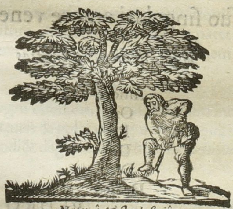
Naturâ & Industriâ.

Ad diem 24. Octobris horâ nonâ matutina.