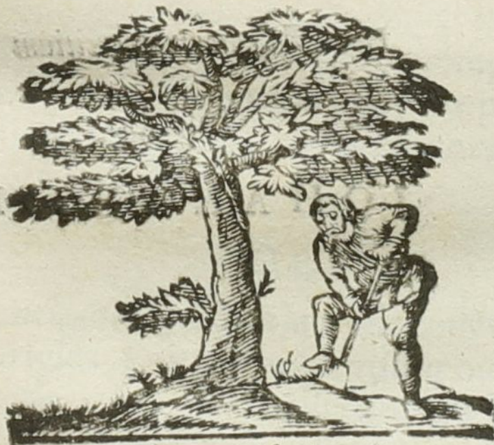
Natura & Industria.