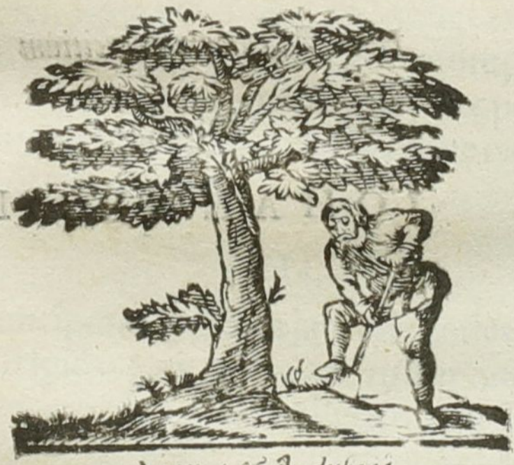
Natura & Industria.