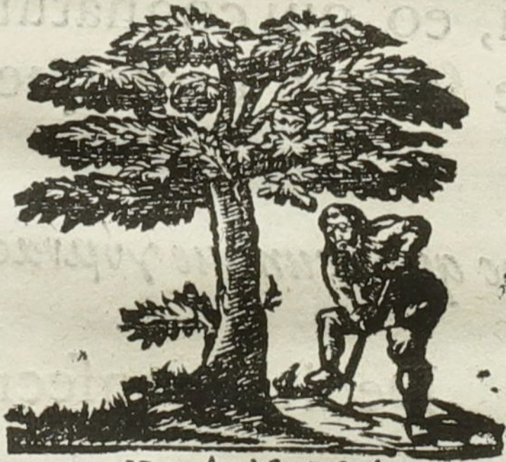
Naturâ & Industriâ.