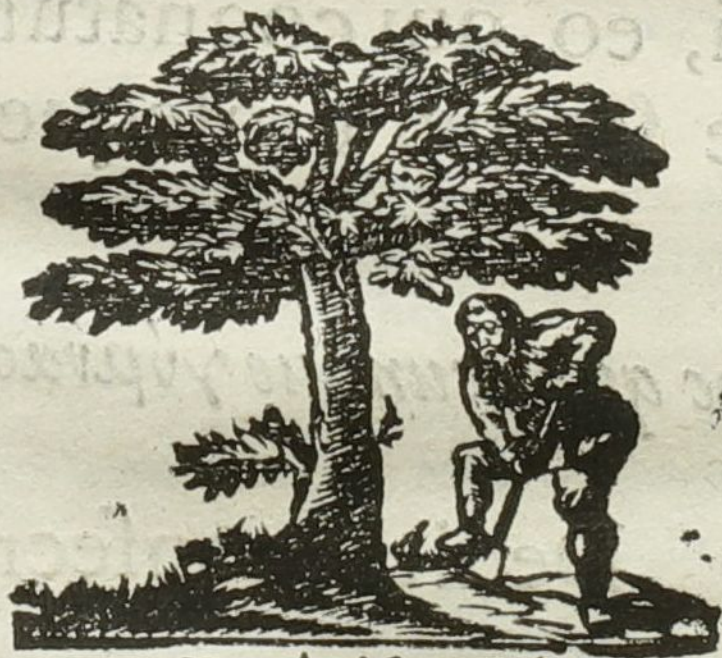
Naturâ & Industriâ.