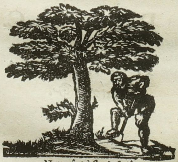
Naturâ & Industriâ.