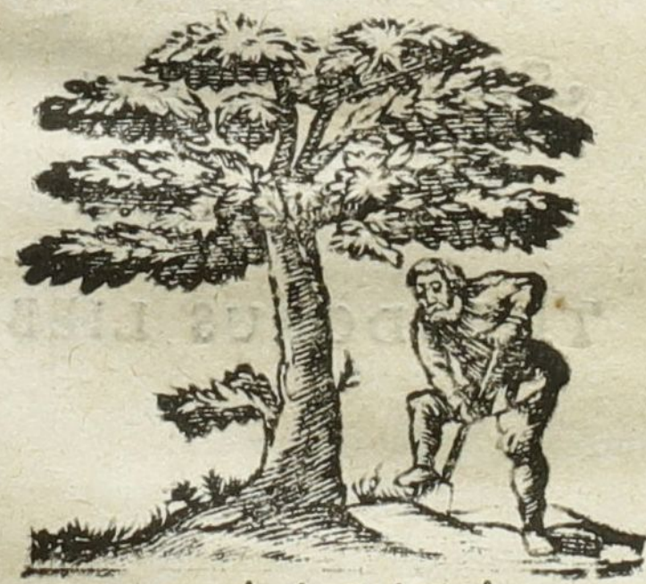
Naturâ & Industriâ.