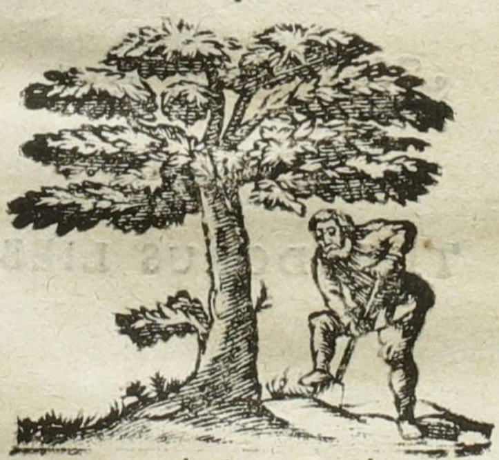
Naturâ & Industriâ.