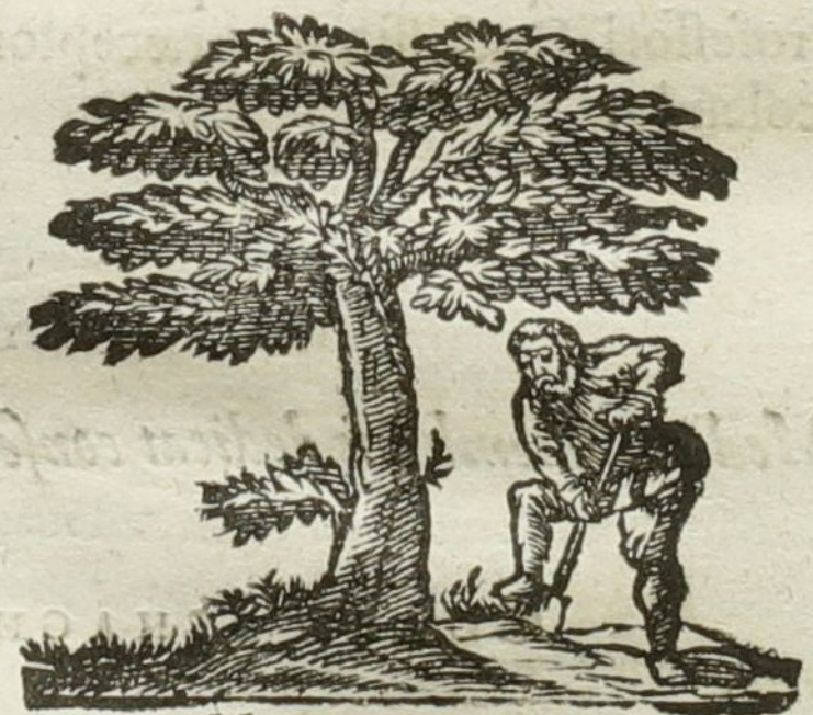
Natura & Industriâ