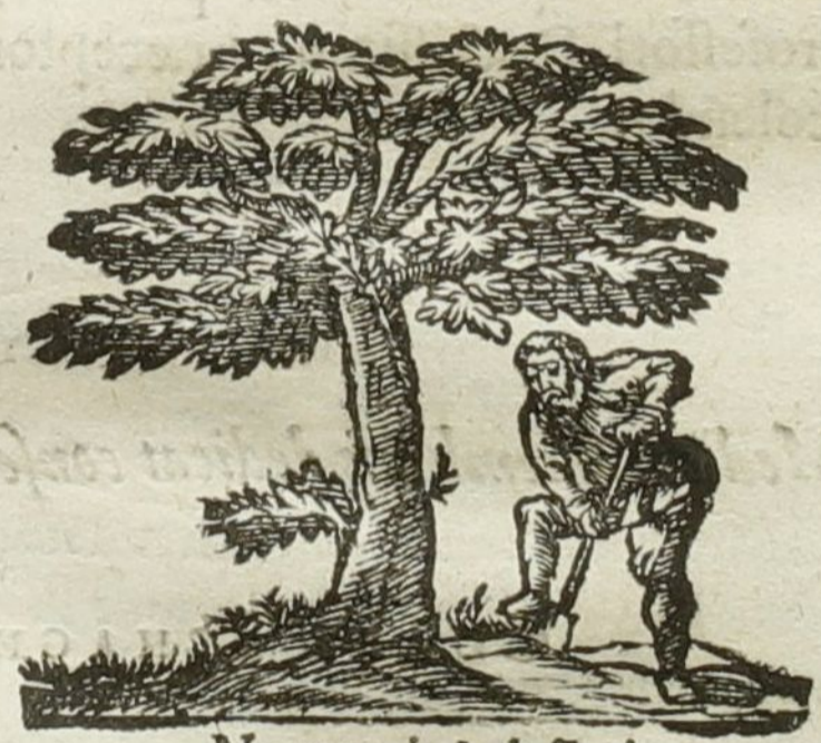
Natura & Industriâ