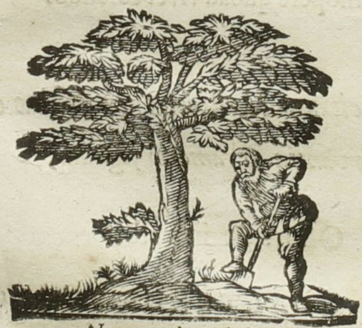
Natura & Industria