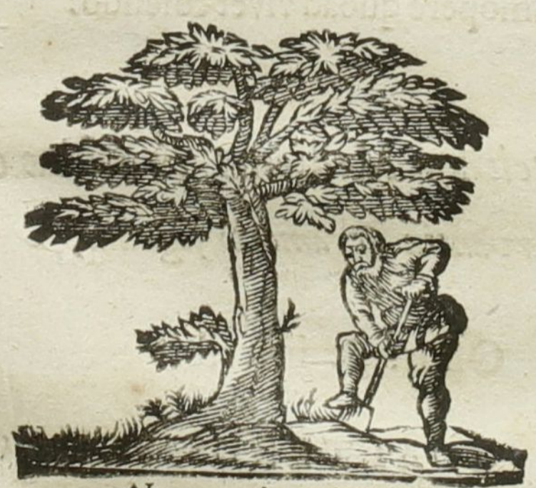
Natura & Industria

Ad diem 2. Decembris horâ locoque solitis.