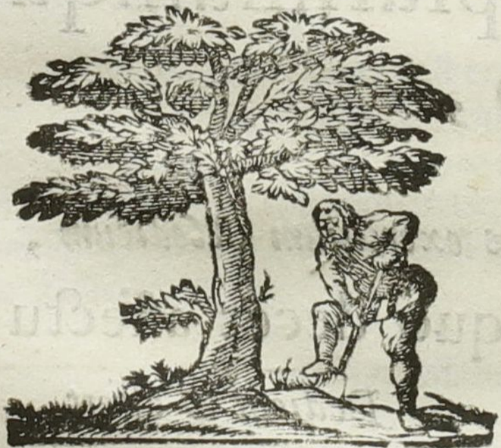
Natura & Industria