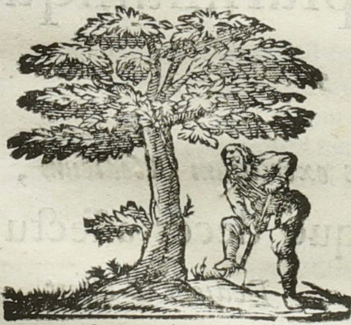
Natura & Industria

Ad diem 6. Decembris horã locoque solitis.