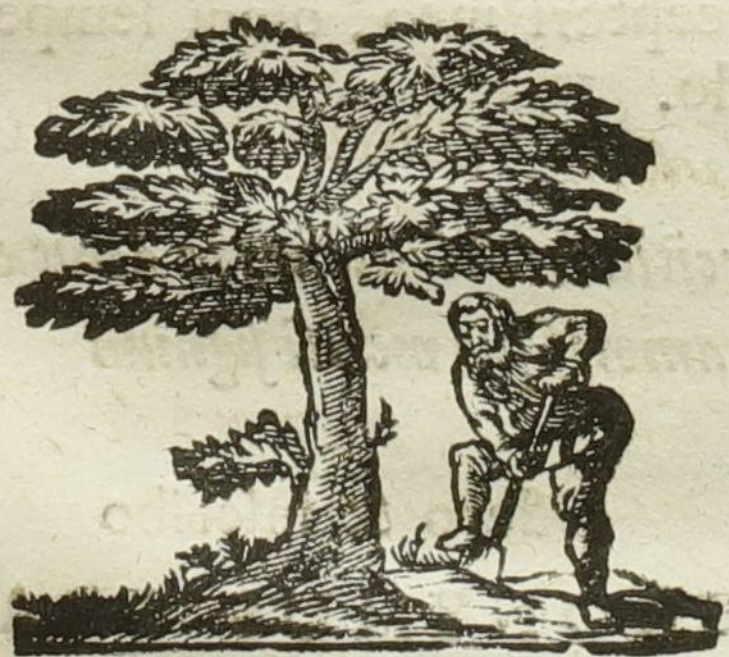
Natura & Industria

Ad diem 10. Martij horâ locoque ſolitis.