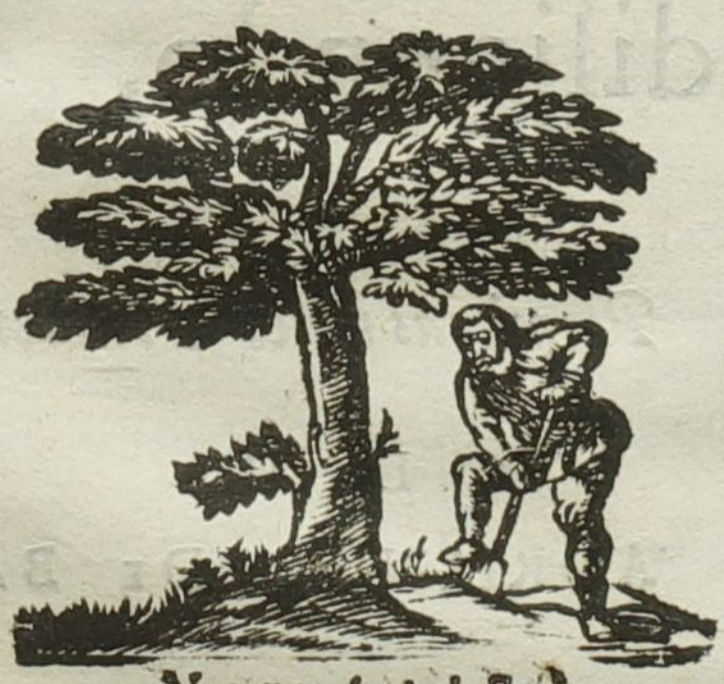
Natura & Industria

Ad diem 31. Octobris, horis locoque solitis.