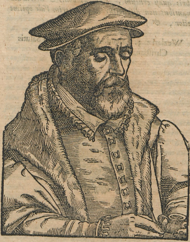
Sacrorum antistes Hammonis in urbe fidelis Illustrum summi dogmata vera Dei.