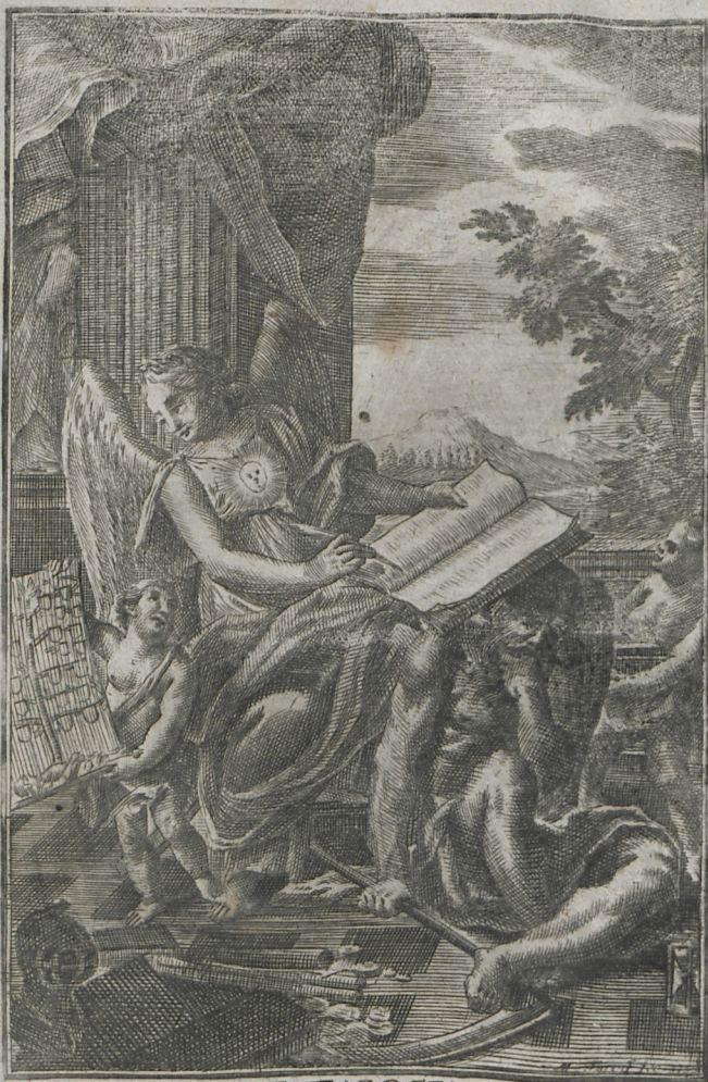
HISTORIA. GENEALOGIA. HERALDICA TESTES TEMPORVM ET VERITATIS