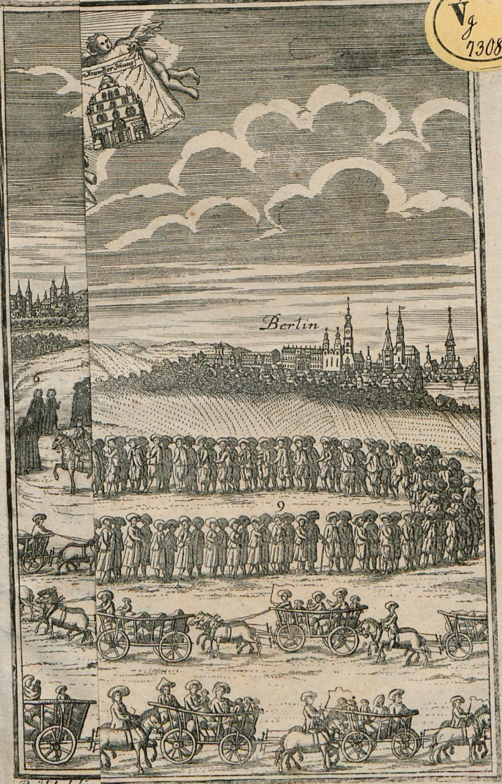
Brühl del. lin.