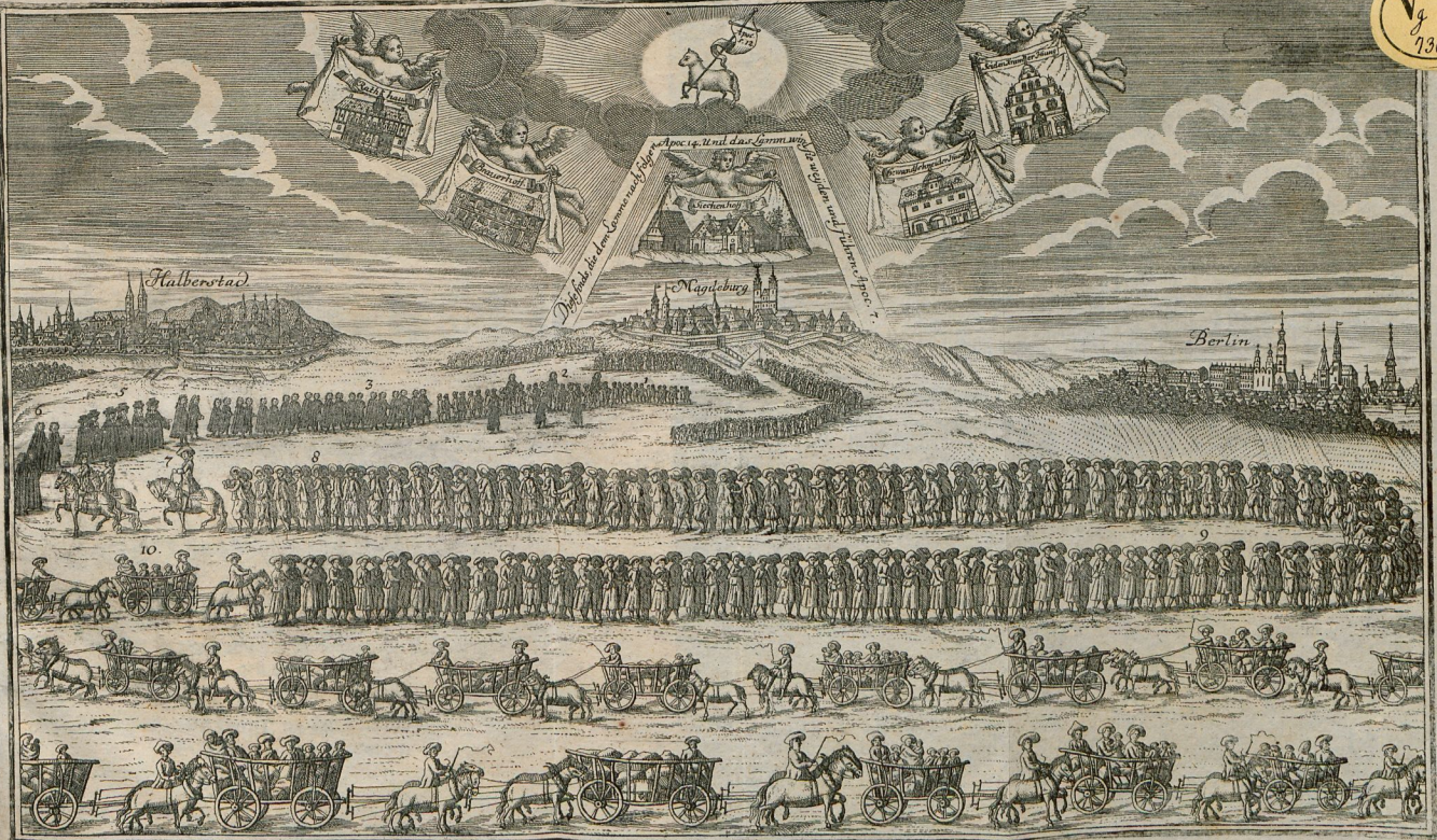
Büchel delin. et sc. Lbr.