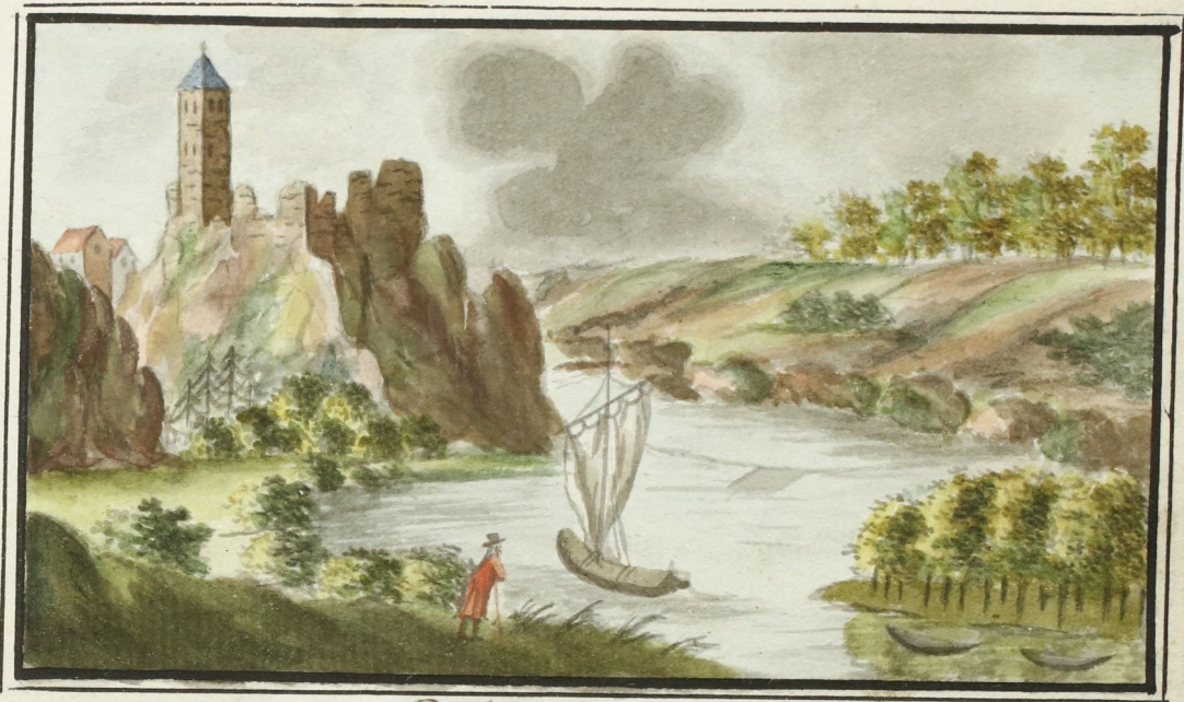
Prospekt von Giebgenstein.