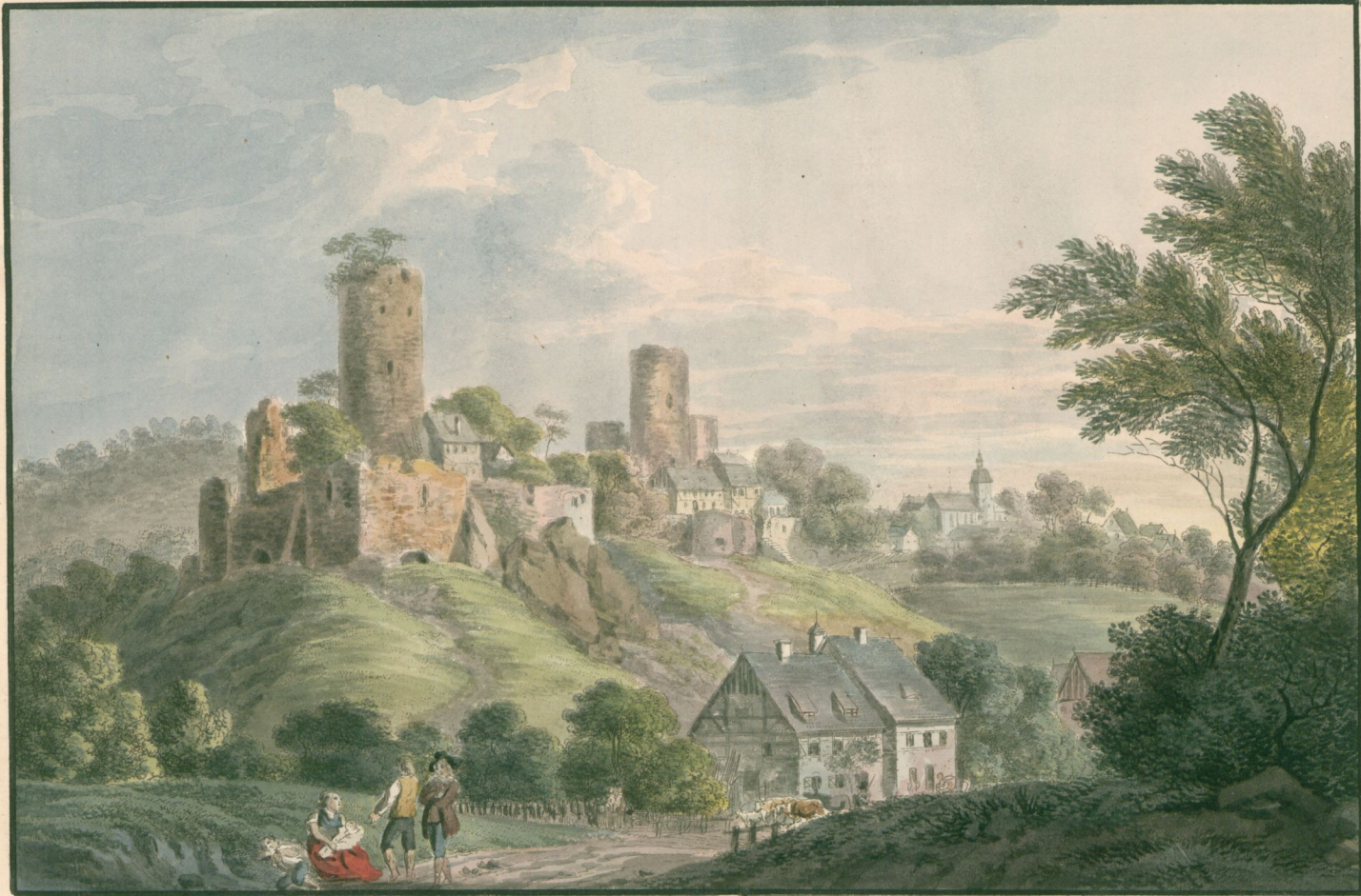
Ansicht der Ruine von Chren bei Altenberg in Sachsen, wo Herz v. Kauffungen wegen des Sachs. Prinzenraubes im Gefangnis verwahrt wurde. V. 2