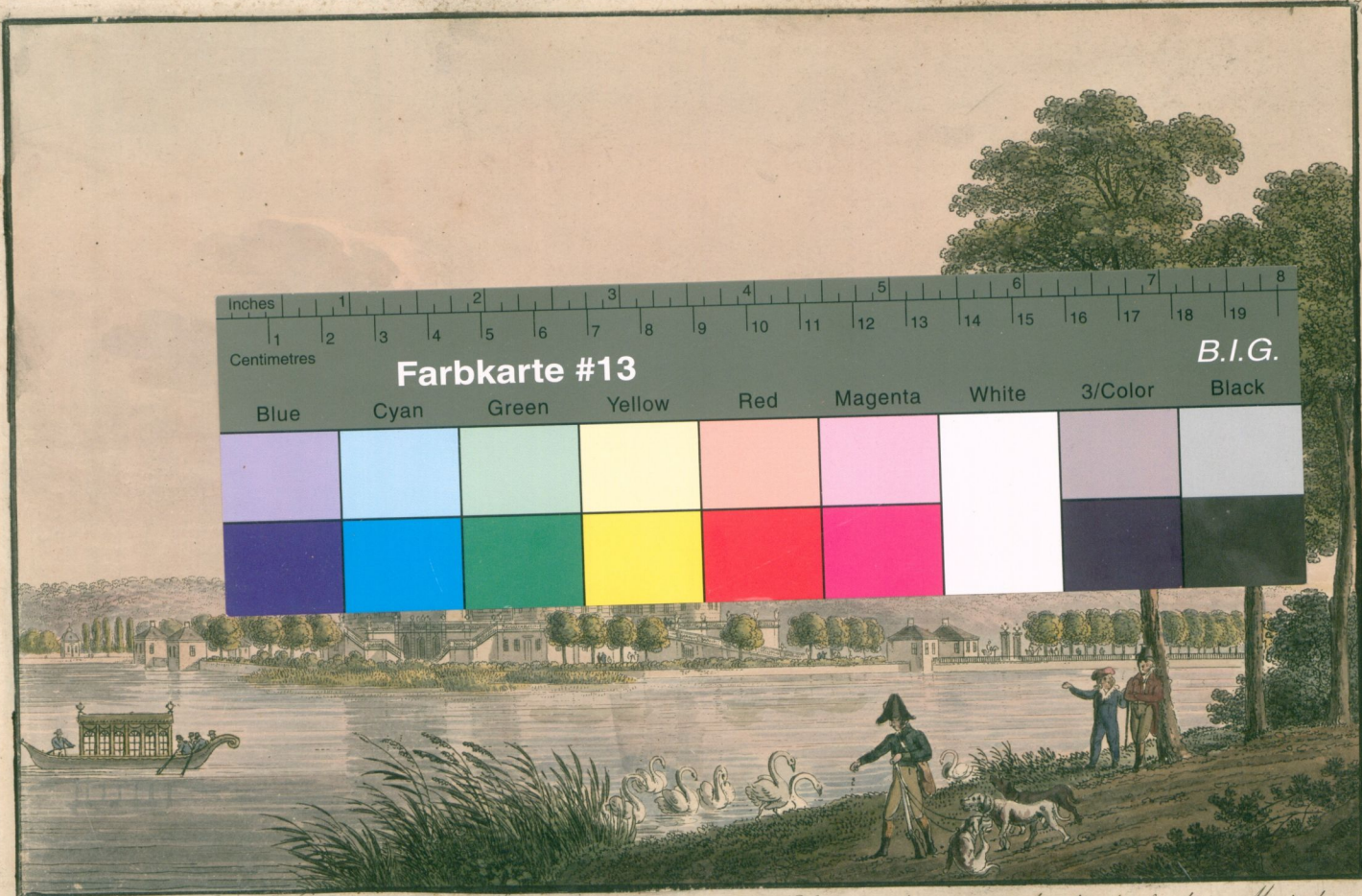
VI. Ansicht des Königlichen Jagdschlösses Moritzburg ohnweit Dresden.