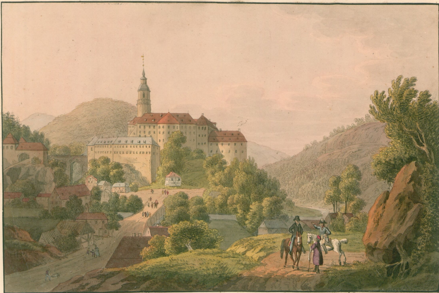
Anficht des Schlosses Weissenstein bei Dohma.