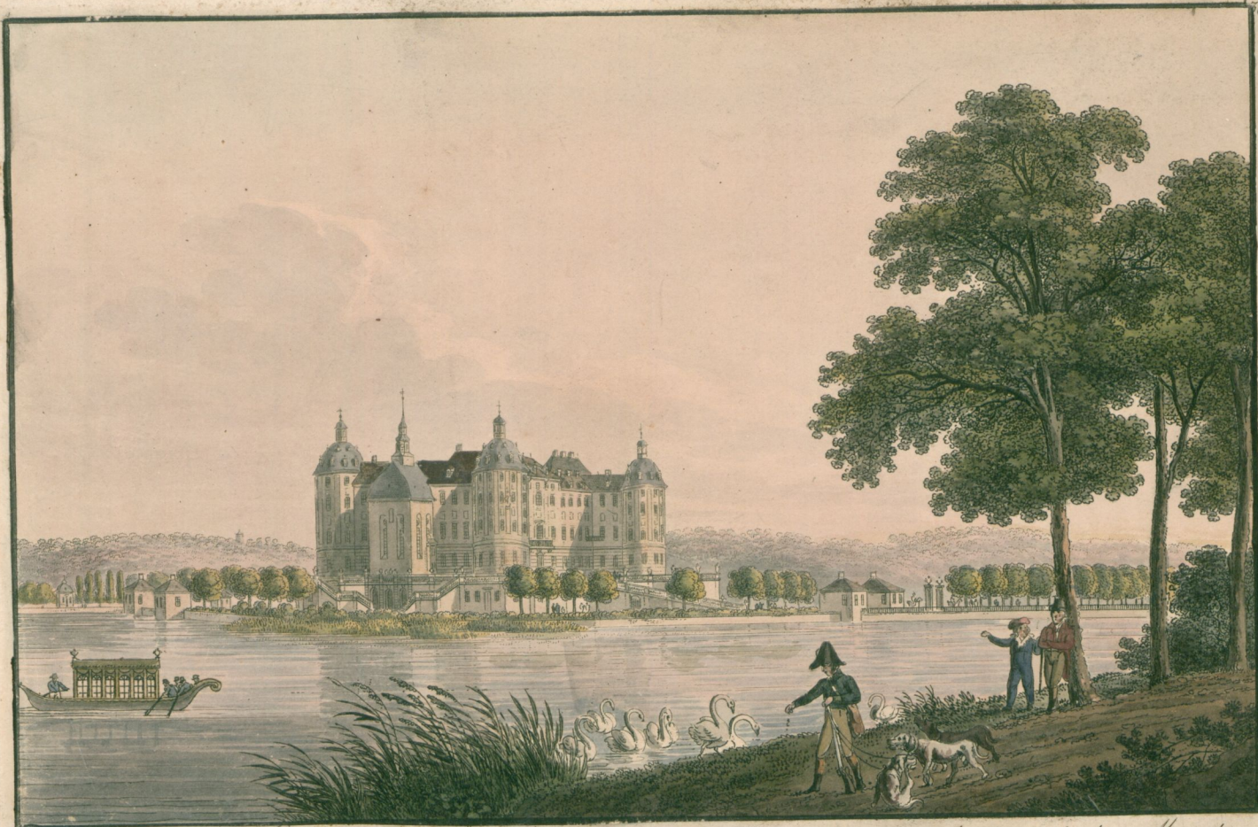
VI. Ansicht des Königlichen Jagdschlösses Moritzburg einweit Dresden.