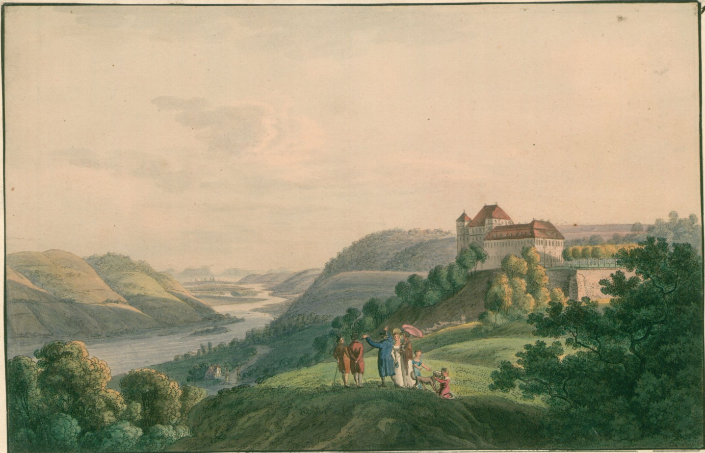
Anficht des Schlosses Siebeneichen bei Meissen mit der Aufsicht nach Dresden