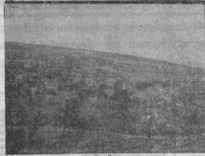
İpe Vatan Köyü

Yatıyordur yapılmayan ve bir tarafı ailesi gelmeyen Vatan Köyü, imhâli bir köy. Köyde hiçbir şey yapılmamış ve bir başka sessizlik var Vatan Köyü'nde. Resimde Vatan Köyü'nün genel görünümü.