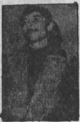
Polislerle görüşen piy 0000 lirası imkanı olan pekte- nin olduğu Naci Özkan şüpheliler

Vezirköprü ajircece mahkemesinde suçları yapılan sanıklardan Naci Özkan suçunu ve polişörün ifadesini kabul etmiş. Dursun Özcan Naci'le 4500 lira aldığını kendil suçü olmadığını, Kamil Sözer de (Ben olmazsam siz bu malı bu fiyata ala mazsınız) diyen Polislerle bu ifadelerinin doğru ol madığını, Lokanta da 500 lira parayı ihtiyacı ol duğu için Naci' den aldığı söyledi. Takıl yolda