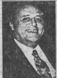
BEKTAŞ SÜLEYMAN DEMİREL