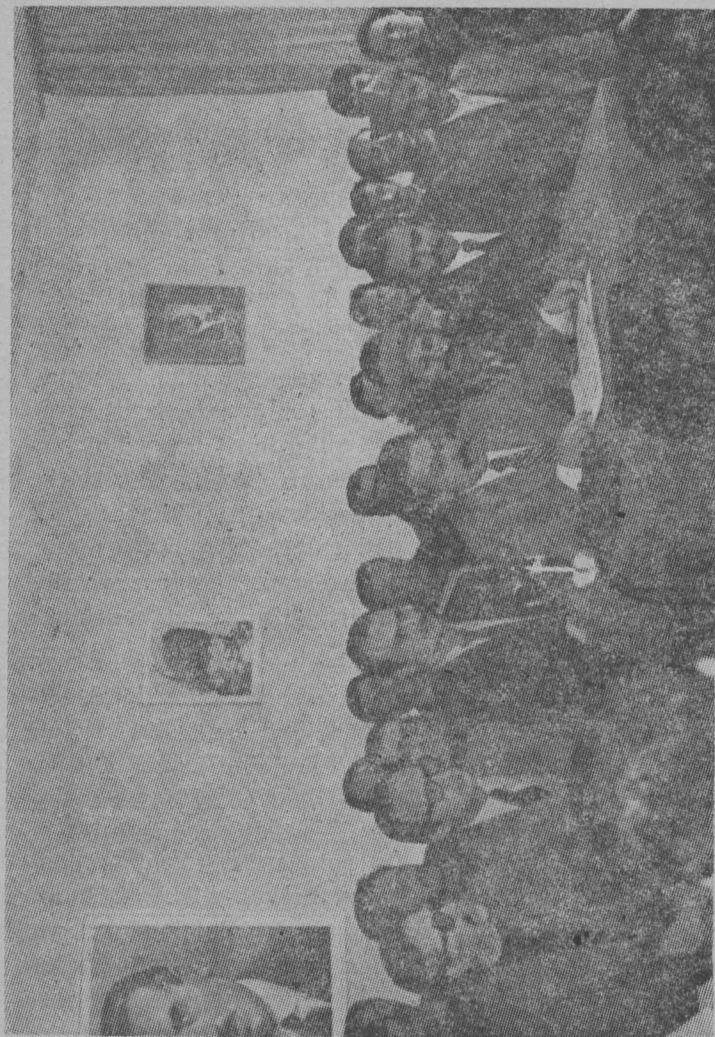
Kurucular ve ilk üyeler 30 Ocak 1978 Pazartesi günü Parti merkezinde yapılan basın toplantısında