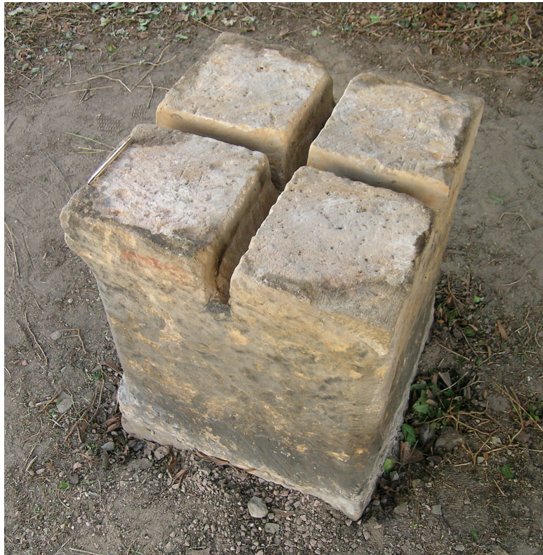
Abb. 4 Sandsteinsockel des Melanchthon-Tischs. April 2010.

alten Sandsteinsockel angebracht werden.