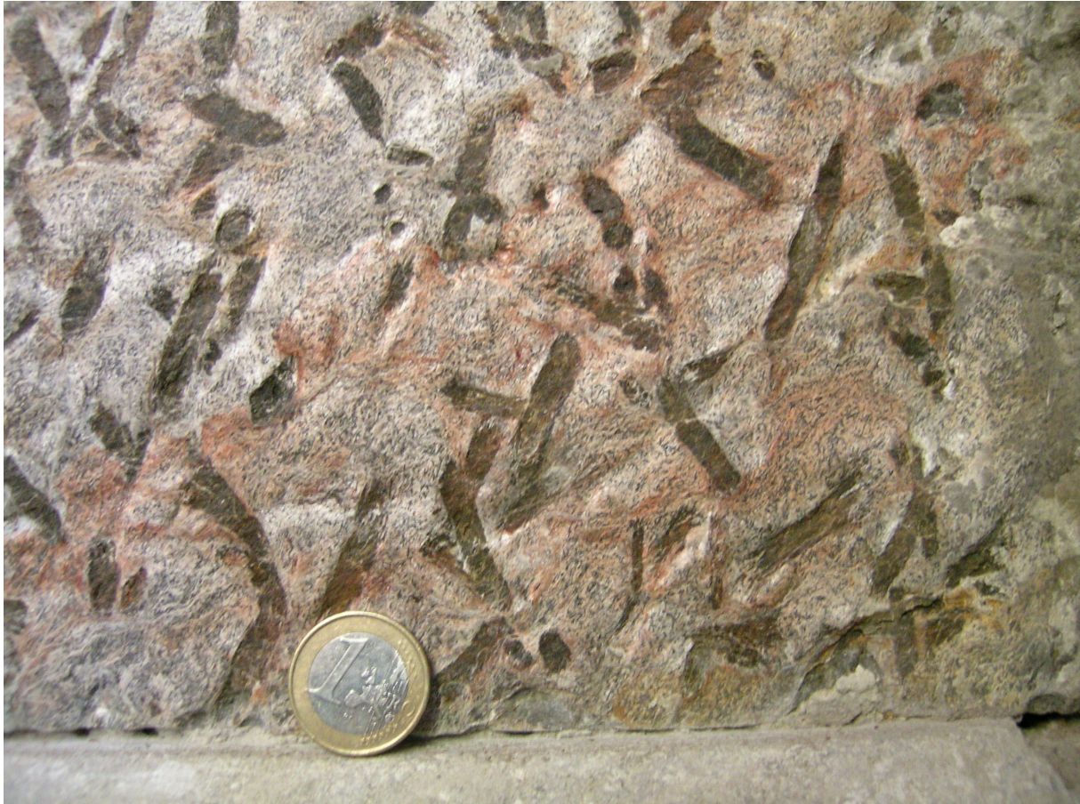
Abb. 11 Naumburger Dom. Wechselburger Garbenschiefer an der Rückwand des Chorgestühls.