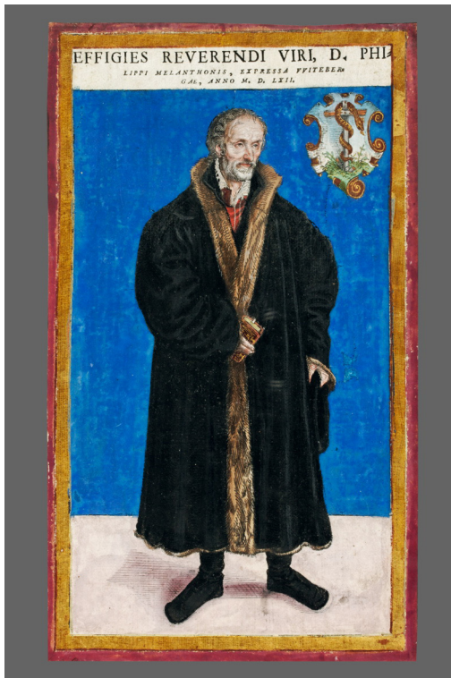
Abb. 1 PHILIPP MELANCHTHON, Holzschnitt auf Pergament, 1562, Lucas Cranach d. J. (Werkstatt). Stiftung Luthergedenkstätten in Sachsen-Anhalt, Wittenberg.