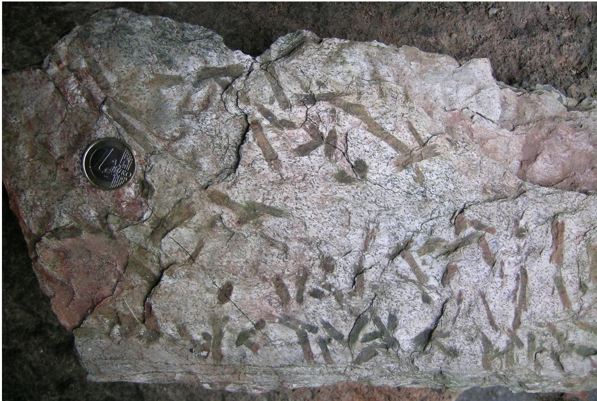
Abb. 9 Wechselburger Schiefer, Lesestück beim Heimatmuseum Wechselburg.