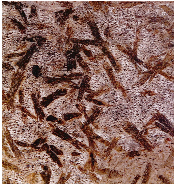
Abb. 12 Wallonerkirche in Magdeburg. Fliese von Wechselburger Garbenschiefer auf der Altarplatte. Ded. Dipl.-Restaurator K. BÖHM, Landesamt für Denkmalpflege und Archäologie Sachsen-Anhalt, Halle. Bildbreite ca. 12 cm.