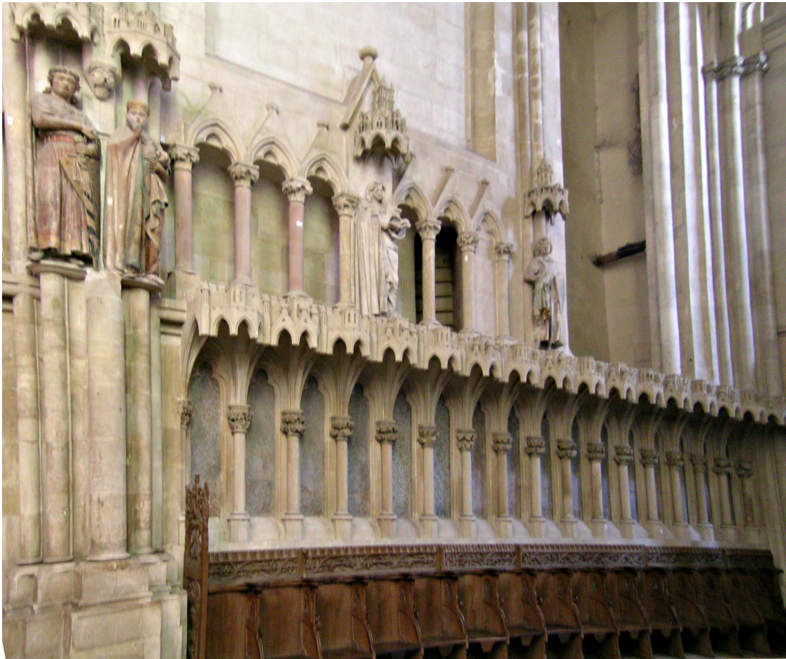
Abb. 10 Naumburger Dom. Rückwände des Chorgestühls zwischen den Säulen bestehen aus ca. 158 x 33 x 3 cm großen durchgehenden oder geteilten Dekorplatten von Wechselburger Garbenschiefer.

Restaurator K. BÖHM, Halle; Abb. 12). Die dunklen Mineralneusprossungen sind unregelmäßig und nehmen etwa 30 % der Oberfläche ein. Sie sind bis etwa 3 cm lang und 0,5 cm breit, überlagern sich gelegentlich und flasern manchmal an den Enden auf. Die Platte ähnelt somit stark den Wechselburger Schieferplatten und der Platte des Melanchthon-Tisches.