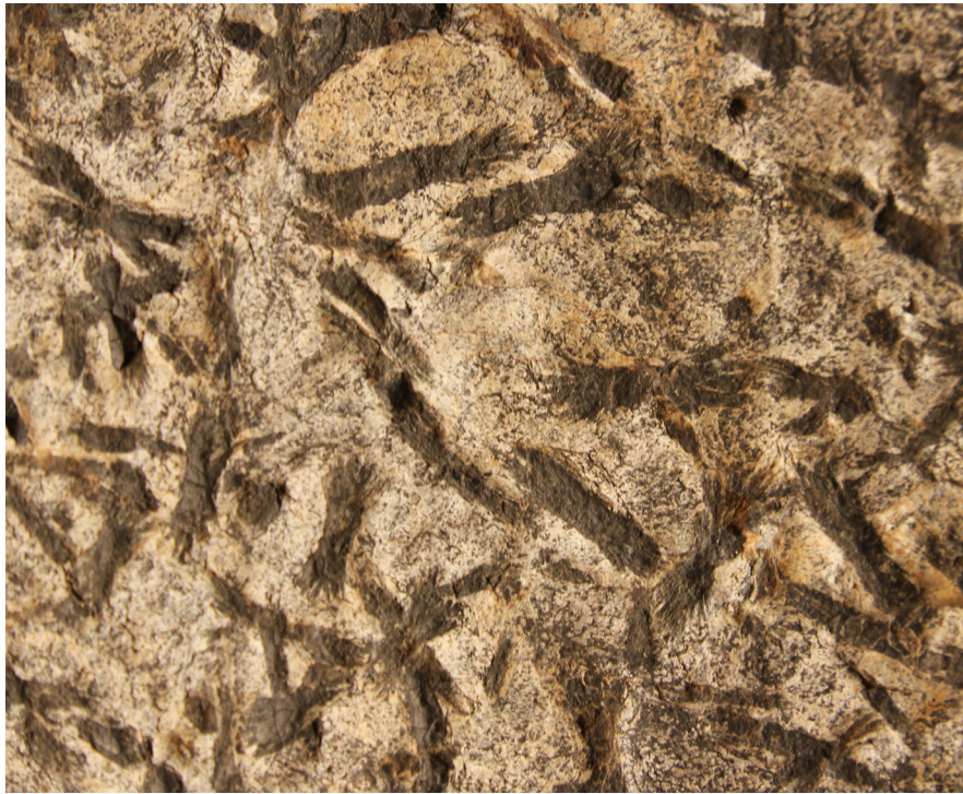
Abb. 6 Nahaufnahme der pseudomorphen Mineralneusprossungen, ursprünglich wohl Staurolith mit typischen Garbenstrukturen (Länge ca. 4 cm).

Der perlmuttartige Glanz stammt von Muskovit-Sprossungen auf den Schieferungsflächen während einer Regionalmetamorphose, welche die Stärke der Gneis-/Glimmerschiefer-Stufe erreicht hat (entsprechend der Amphibolit-Fazies nach ESCOLA 1920). Der lepidoblastische metamorphe Schiefer (d.h. mit blättchen- oder schuppenförmigen Mineralen) ist parallel geschiefert. Bei näherer Betrachtung erkennt man einkörnige Quarzit-Lagen mit Dicken von weniger als 1 mm, welche unregelmäßig auch schwach Feldspat führen, und mit Muskovit-Lagen von deutlich unter 1 mm wechsellagern. Diese Wechsellagerung führt durch differenzierte innere Deformation zu einem schwach flaserigen Charakter der Absonderungsflächen. Nach der Nomenklatur von PFEIFFER et al. (1985) kann das Gestein als „Feldspat-führender Glimmer-Quarzschiefer“ angesprochen werden. Bei den größeren schwarzen Einschlüssen auf den Schieferungsflächen handelt es sich um gestreckte flache Kristallneusprossungen. Diese Mineralneubildungen treten üblicherweise regellos,