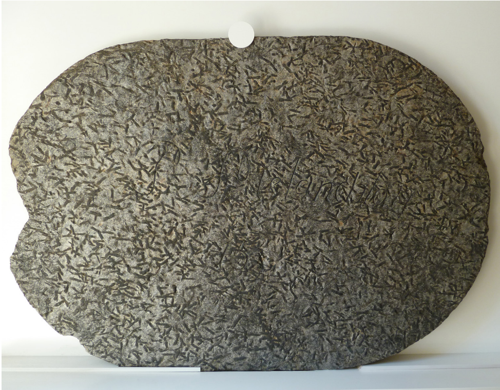
Abb. 5 Platte des Melanchthon-Tisches im Flur des Melanchthon-Hauses, gereinigt und restauriert, Juni 2014. Die Inschrift: „P Melanchton / 15.“ ist aufgrund der Beleuchtung nur undeutlich sichtbar. Vgl. SPERNAU et al. (2015, dieser Band).

Die Herkunft der Tischplatte und ob es sich tatsächlich um ein Originalmöbel des Reformators handelt ist urkundlich leider nicht belegt. Ein populäres Bild zeigt MELANCHTHON und seine Freunde, wie sie an diesem Steintisch unter dem Eibenbaum sitzen (Abb. 2). Diese Abbildung ist jedoch jünger und wurde erst um 1865, lange nach Lebzeiten des Reformators gefertigt (HENNEN 1997). Die Eibe ist heute etwa 7 m hoch und hat einen Stammdurchmesser von 50–55 cm. Sie soll angeblich auch aus MELANCHTHON'S Zeit stammen (BELLMANN et al. 1979), dürfte jedoch kaum älter als 250 Jahre sein (HENNEN 1997).