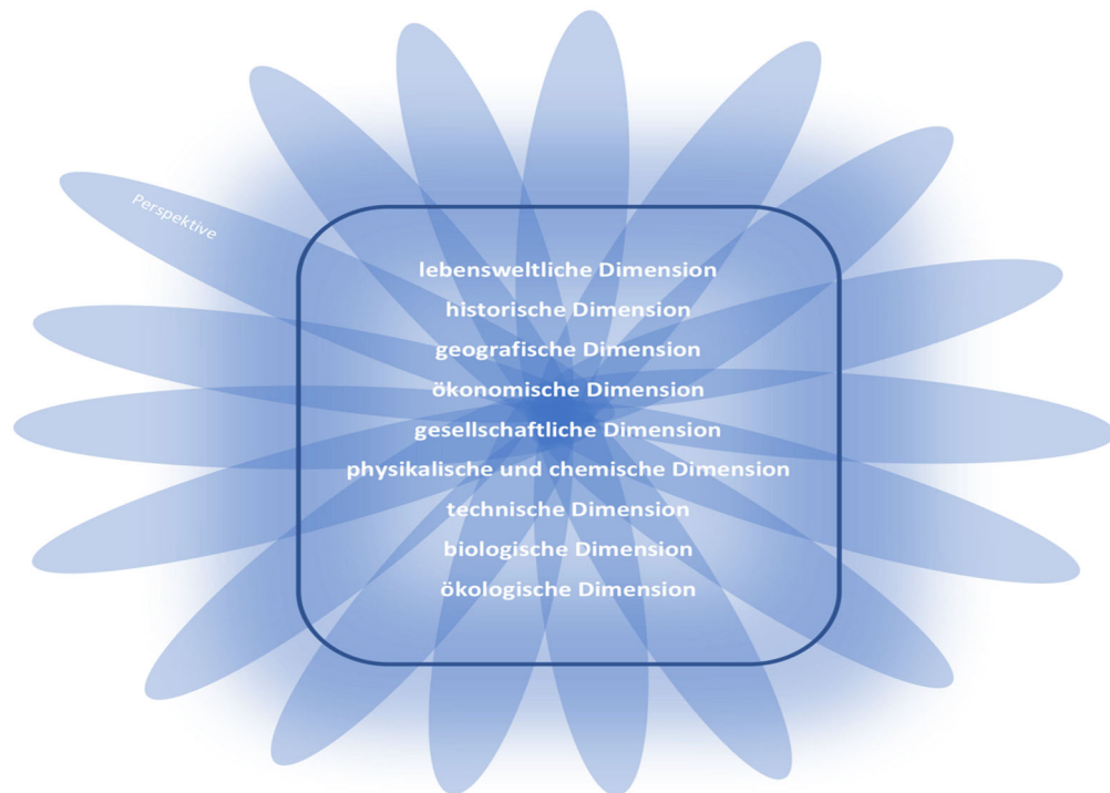
Abbildung 1: „Das Verständnis der Begriffe Dimensionen & Perspektiven im Sinne Köhnleins“ (eigene Darstellung auf Basis der Auseinandersetzung mit Köhnlein, in Anlehnung an das Kompetenzstrukturmodell für die Grundschule im Heimat- & Sachunterricht, Bayern).

Im Zentrum stehen Köhnleins (2012) neun Dimensionen. Durch die Sammlung aller Dimensionen in einem Kästchen soll deren starke Vernetzung und Durchdringung verdeutlicht werden. Durch diese Darstellungsweise soll ihre Gesamtheit und die sich dadurch ergebende Einheit des Sachunterrichts repräsentiert werden. Dabei soll der Rand des Kästchens nicht als feste Grenze gesehen werden, sondern vielmehr gehen die Perspektiven aus den Dimensionen hervor. Die Anzahl und die Auswahl der Perspektiven ist vom Individuum abhängig, daher sind keine festgelegten Perspektiven vorhanden.