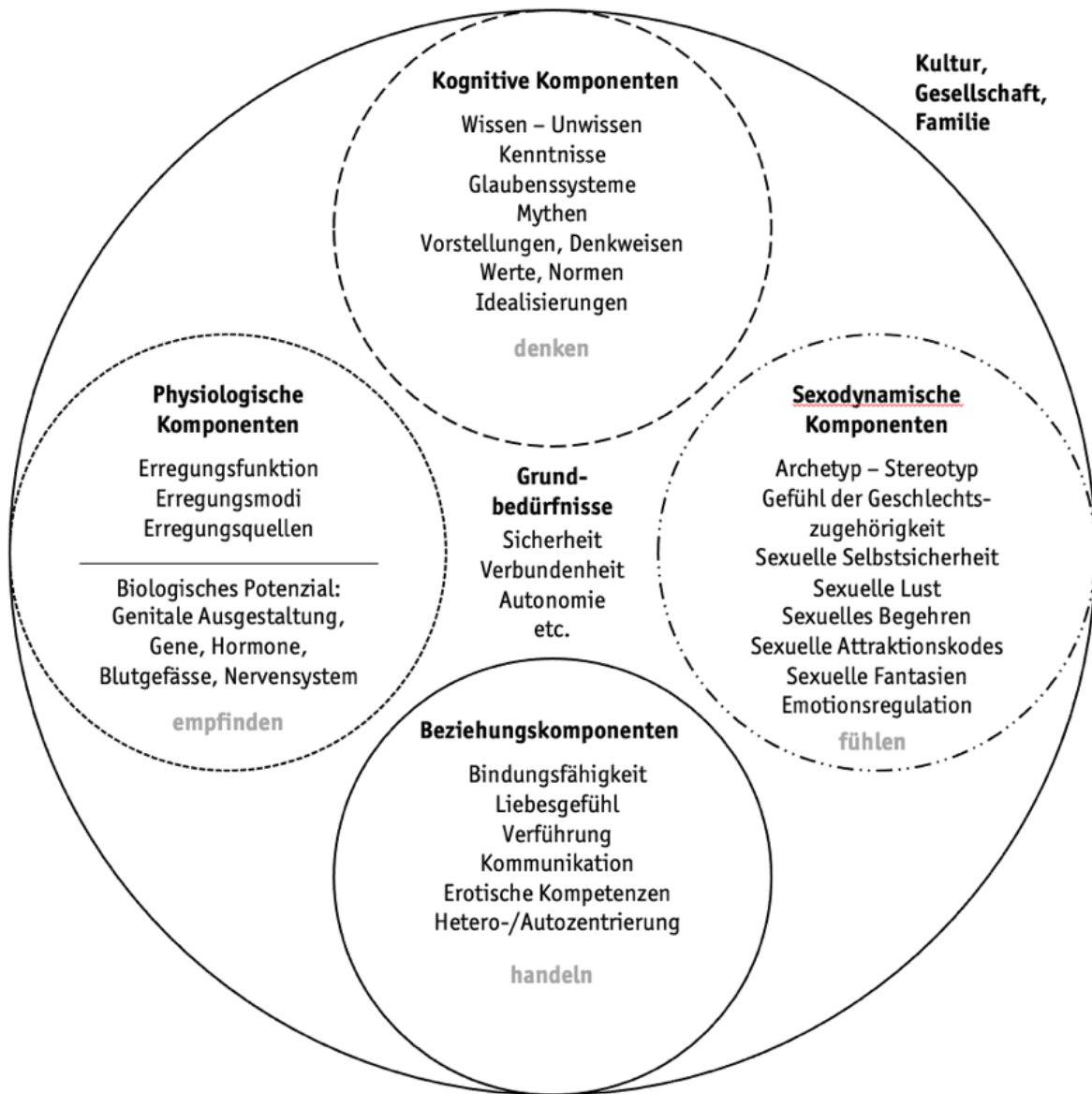
Abb. 1: Das Modell Sexocorporel (Schütz, 2020, S. 408; Sztenc, 2020, S. 58; ZISS, 2022)

des Modells sind. Diese Darstellung unterstützt Sexualtherapeut*innen in der Evaluation eines sexologischen Anliegen und der entsprechenden therapeutischen Begleitung der Klient*innen.