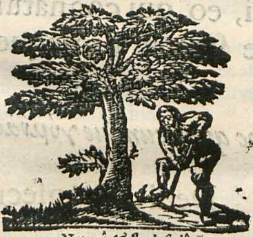
Naturâ & Industriâ.