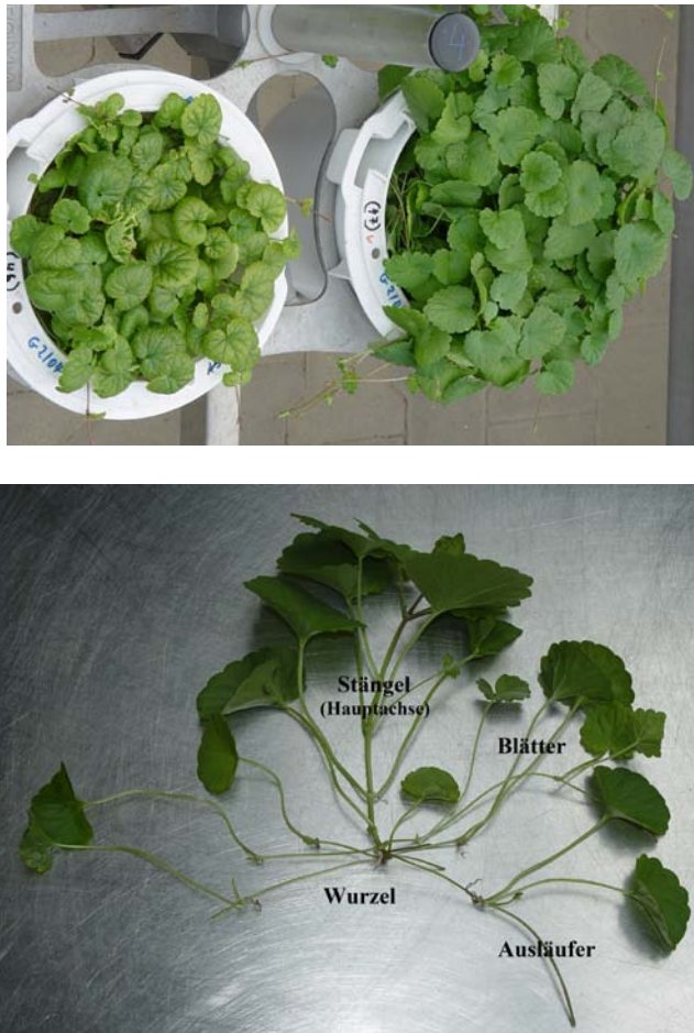
Abb. 1 Stecklinge von Gundermann ( Glechoma hederacea L.) kultiviert im Gewächshaus auf Quarzsand in Kick-Brauckmann Gefäßen. Oben links: Dünger-Stufe: 211,08 mg N im \text{NH}_4\text{Cl} . Oben rechts: 211,08 mg N im \text{KNO}_3 . Unten: Spross: Stängel (Hauptachse), Blätter, Wurzelansätze und Ausläufer).

Die biochemischen Untersuchungen zur N-Aufnahme und N-Verwertung wurden im Gewächshaus mit kultivierten Stecklingen durchgeführt. Einbezogen wurde auch Brennnessel ( Urtica dioica ) sowie Untersuchungen an verschiedenen nitrophilen Pflanzenarten im Freiland, um charakteristische Merkmale von Glechoma hederacea zu vergleichen.