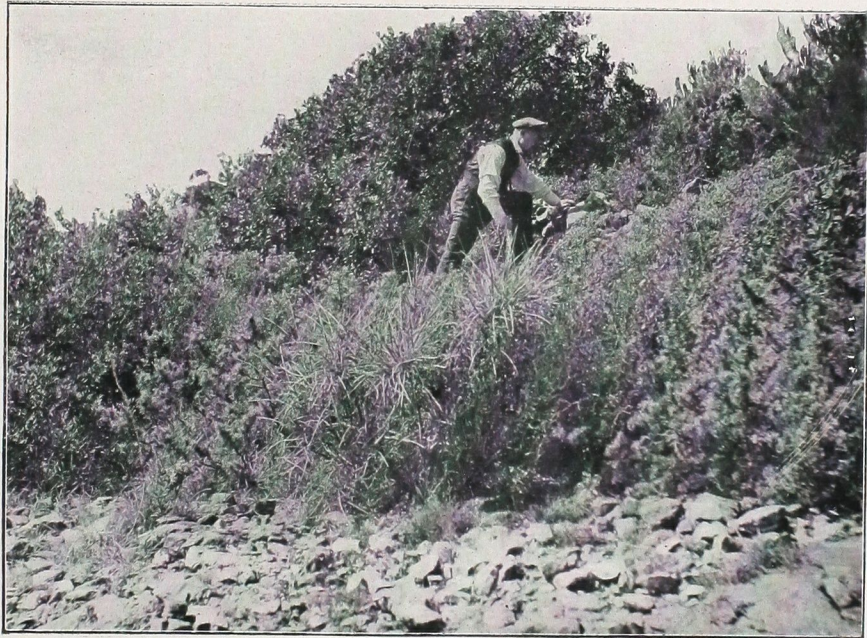
Macchie bei Rovigno am Meere.

an das nteil ist Hasel- strosen, rfenden Während hränkte nannten, te Meer schnellere ewächse hon im bei den en und können aben in itte Mai ürchten, speriode nd. Man